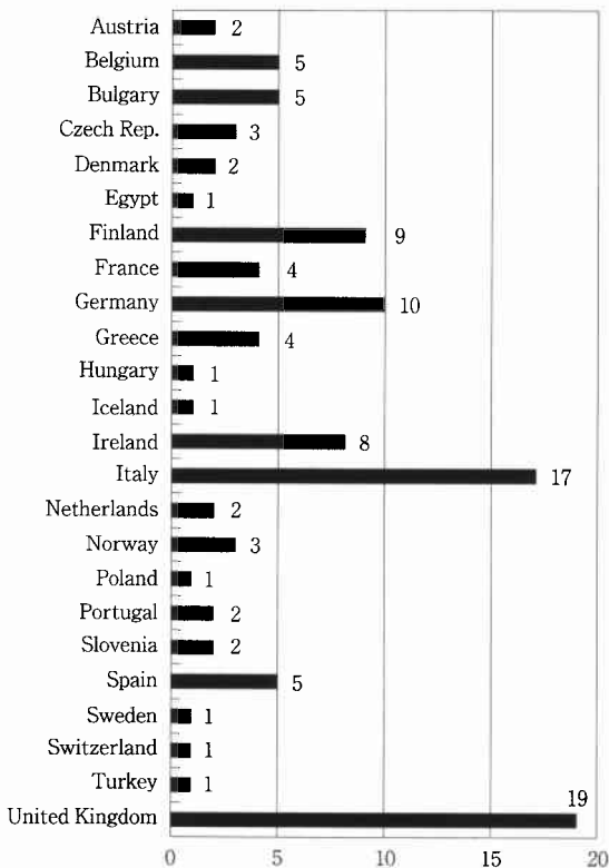
図1 ヨーロッパ各国の鍼関係学協会数

鍼灸の研究の方法論に関する関心は、日本を含んで世界的なものである。1989年に AIAM はローマで National Symposium on Research Methodology on Acupuncture を開催している。これとは独立して、1993年に京都での WFAS Third World Conference on Acupuncture の際に全日本鍼灸学会学術部研究委員会情報評価班が主体となって開いた Workshop on Clinical Research Methodology for Acupuncture では INCRA (Informal Network for Clinical Research Methodology on Acupuncture) が設立された。このネットワークには AIAM のメンバーも入り、翌1994年の青森での WHO Working Group on Clinical Research Methodology for Acupuncture